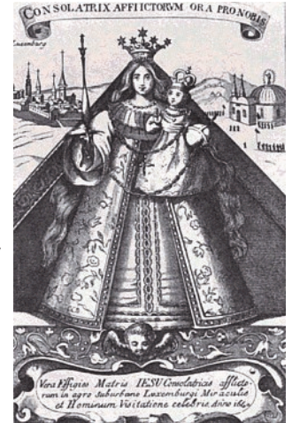
Das Gnadenbild in Kevelaer

Die Frauengemeinschaft Lich-Steinstraß führt auch in diesem Jahr wieder ihre Bus-Wallfahrt nach Kevelaer zur „Trösterin der Betrübten“ durch. Sie startet am Fest Maria Geburt, am Dienstag, dem 8. September, als Ganztagswallfahrt.